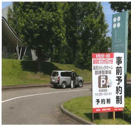
長岡花火 公式駐車場