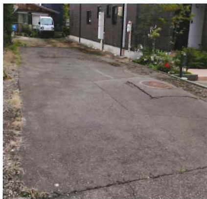
利根川花火 徒歩15分 5,000円/1台