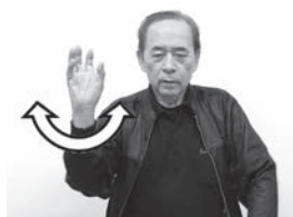
指先を曲げて上向きにした右手を顔の横で回します。