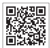
動画はこちらから