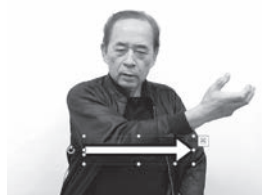
回しながら右から左へ動かします。