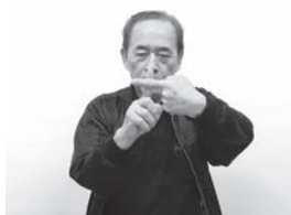
両手人差し指で「十字」を作ります。