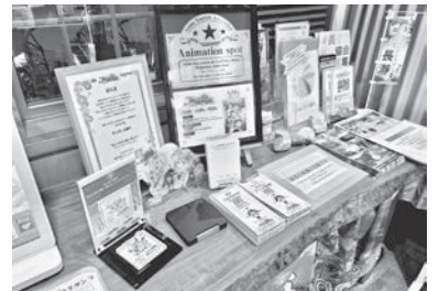
認定プレート及びご朱印スタンプ設置状況