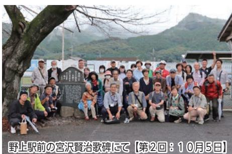
野上駅前宮沢賢治歌碑にて【第2回：10月5日】