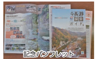
記念パンフレット