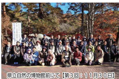
県立自然の博物館前にて【第3回：11月30日】

教育委員会では、町文化財保護審議会の協力のもと、名勝及び天然記念物「長瀬」指定100周年記念特別講座を開催しました。第2回は「文人墨客が訪れた長瀬」、第3回は『「日本地質学発祥の地」を訪ねる』をテーマに開催し、町内外から多くの方々に御参加いただきました。