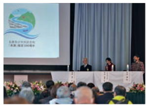
記念式典（トークセッション）