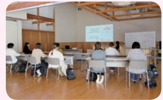
保育をお願いし真剣に受講するママ達