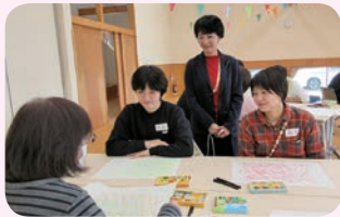
アートセラピー講座 グループ発表