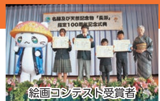
絵画コンテスト受賞者

※これらの事業は、宝くじの社会貢献広報事業として、宝くじの受託事業収入を財源に(一財)自治総合センターが実施している「コミュニティ助成事業」を活用し実施したものです。