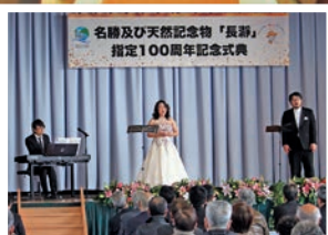
るるみゅーじっくによる演奏