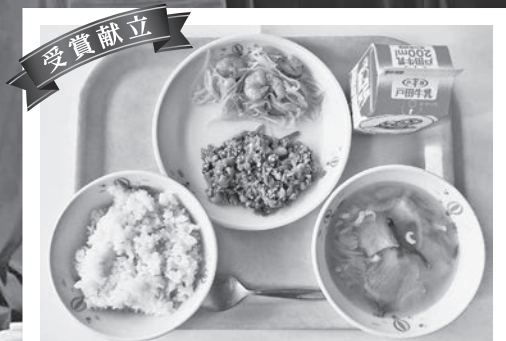
上から 地場野菜のヤムウンセン、しゃくし菜入りガパオ炒め、牛乳、麦ごはん、厚揚げとレタスのスープ