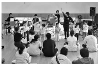
ながとろブレーメンさん