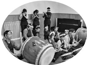
小坂太鼓童会のみなさん

11月17日(日)に多世代ふれ愛ベース長瀬で、「長瀬町子育て応援フェスタ」が盛大に行われ、250人を超える方に参加をしていただきました。