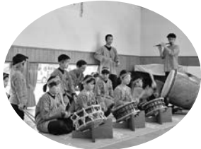
天神会のみなさん