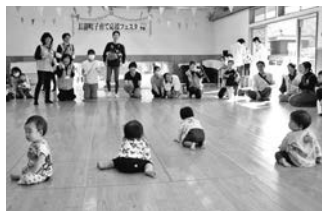
はいはいよちよちレース