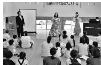
るるる♪みゆ〜じっくさん