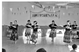
みんなでハワイアン!