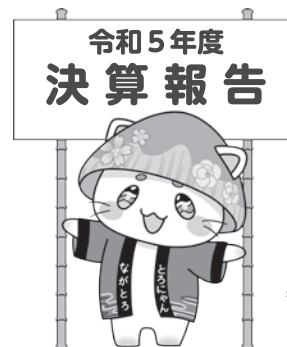
長瀬町公式マスコットキャラクター とろにゃん