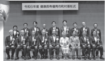
令和6年度 健康長寿優秀市町村表彰式