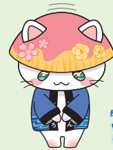
長瀬町公式マスコットキャラクター とろにゃん