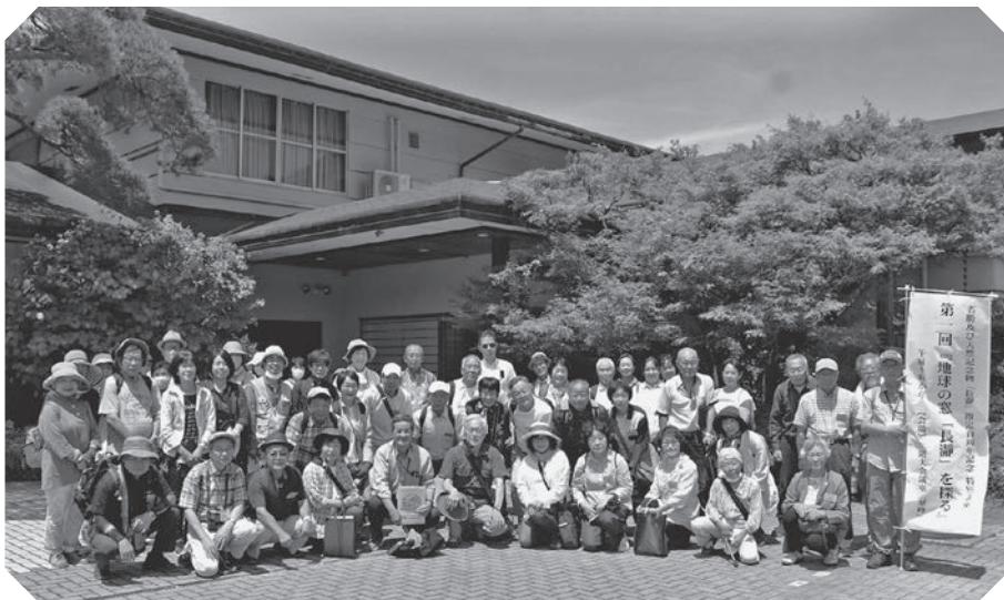
座学会場の長生館前にて

■第1回『地球の窓「長瀬」を探る』には、満員の50名の方に参加していただきました。【6月8日】