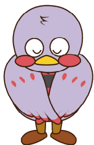
埼玉県マスコット「さいたまっち」

申請は、原則4月1日からです。 4月上旬に受診予定等、3月中に申請する必要がある方は ご相談ください。