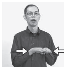
水平に置いた両手を引き寄せ、親指側を付け合わせる動作を