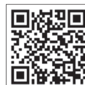
動画はこちらから