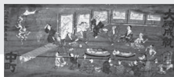
武野上神社の赤痢退散祝奉納額（絵馬）