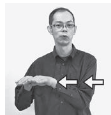
右へ移動しながら繰り返します。