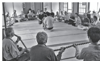
小坂の厄除け念仏（小坂区公会堂）